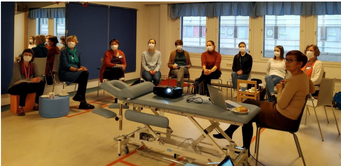
LogoTyö-hankkeen tapaaminen Jyväskylän kaupungin puheterapeuttien luona.