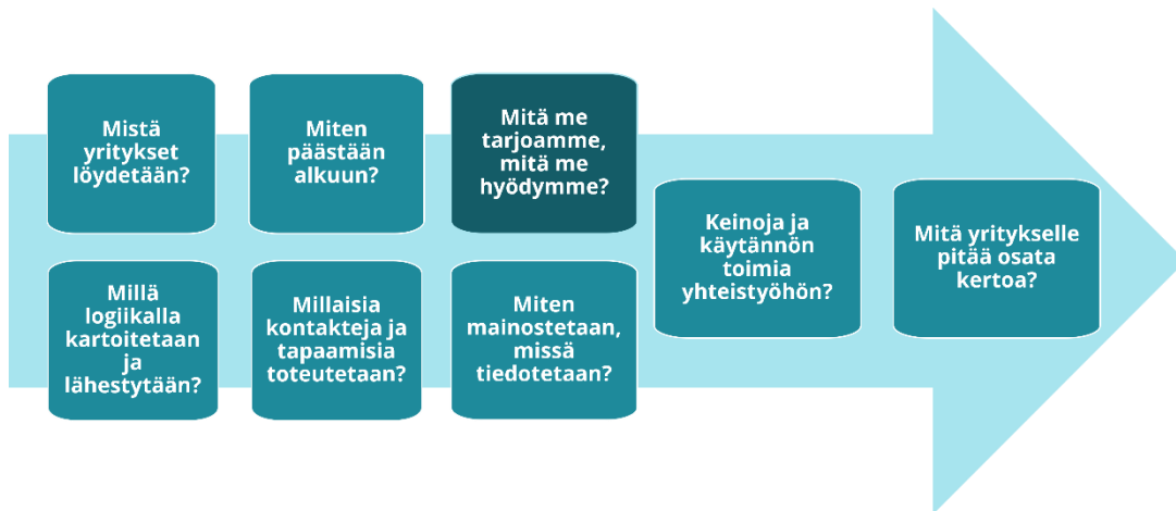
Kuva 2. Yrityskontaktoinnin avainkysymykset.

Joensuu, Kuopio Health ekosysteemi) ja yleiset tietohaut. Yritysten valinnassa huomioidaan muun muassa monipuolisuus, yrityksen koko, alueellisuus, potentiaaliset yhteistyömahdollisuudet sekä ennakkoon tunnistetut tarpeet. Ensimmäinen kontakti yritykseen voi olla hyvin kevyt, kuten yritysvierailut tai opiskelijoiden harjoittelumahdollisuuksien selvittely. Konkreettisesti erilaisia kontaktikanavia ja tilaisuuksia ovat mm. webinaarit, lähitilaisuudet sekä suorat yhteydenotot. Myös tiedottaminen ja yhteistyömahdollisuuksien markkinointi yritysverkostoissa, kuten uutiskirjeiden ja yhteistyökanavien kautta on tärkeää.